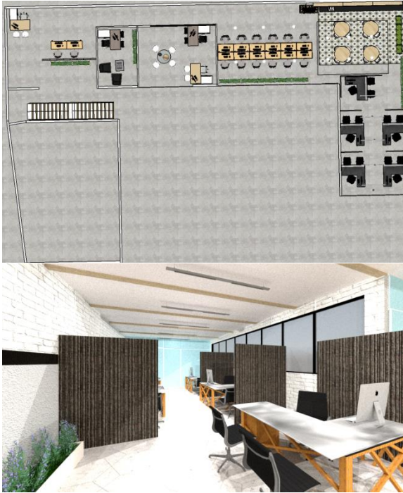
Gambar 3. Penyelesaian Plafond Ruang Dewan Guru