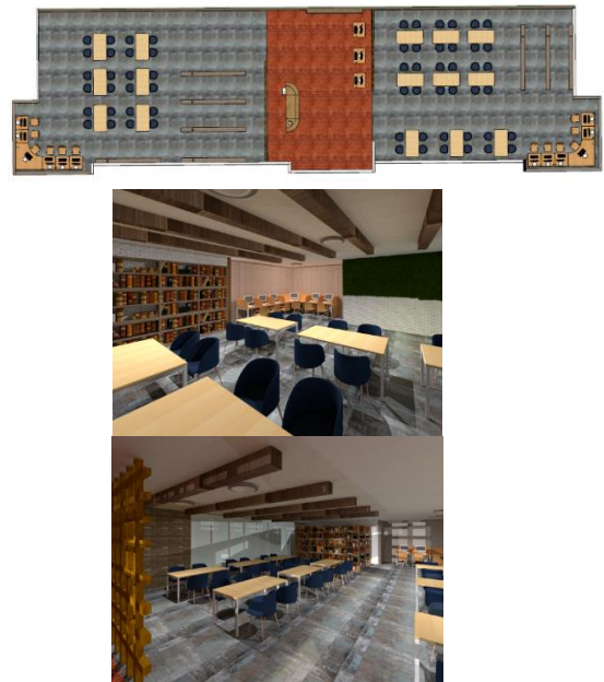
Gambar 2. Hubungan antar ruang Perpustakaan

PPM Al-Faqih Mandiri memiliki beberapa gedung yang terpisah yang menjadi satu kawasan lingkungan pondok Pesantren. Area yang dipilih sebagai denah khusus antara lain, ruang kelas ruang guru, ruang kepala sekolah dan wakil kepala sekolah, asrama dan perpustakaan.