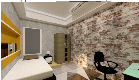
Gambar 4. Perspektif Ruang Kamar (Sumber:Pribadi)